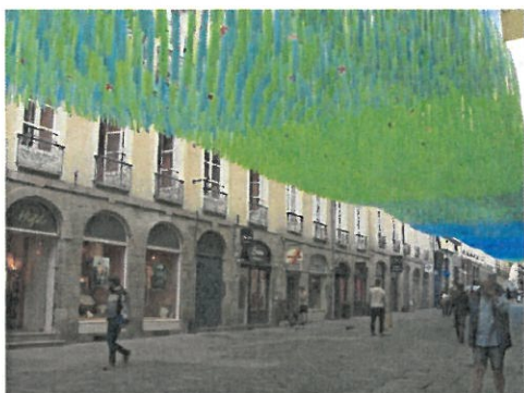
Ciel de rue réalisé avec des rubans