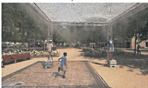
Toile d'ombrage munie de brumisateurs

Ces installations aux structures légères offrent plusieurs avantages majeurs :