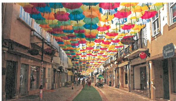
Ciel de rue réalisé avec des parapluies