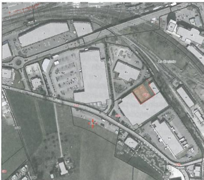
Situation de la parcelle n° 5189

La Municipalité de Delémont est propriétaire de la parcelle n° 5189 du ban de Delémont suite à un échange qui a été signé en 2010 avec l'ancien propriétaire. Ce dernier avait mis à disposition de Lora SA, la société qui exploite La Croisée des Loisirs, le terrain nécessaire à l'aménagement de 94 places de parc, pour les besoins de cette dernière. Un contrat de bail a été conclu pour une durée initiale de cinq ans (du 1 er janvier 2005 au 31 décembre 2009). Il a été renouvelé tacitement et a été repris par la Municipalité suite à l'échange de terrain.