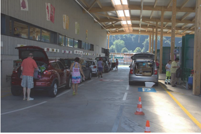
La déchèterie régionale d'Yverdon