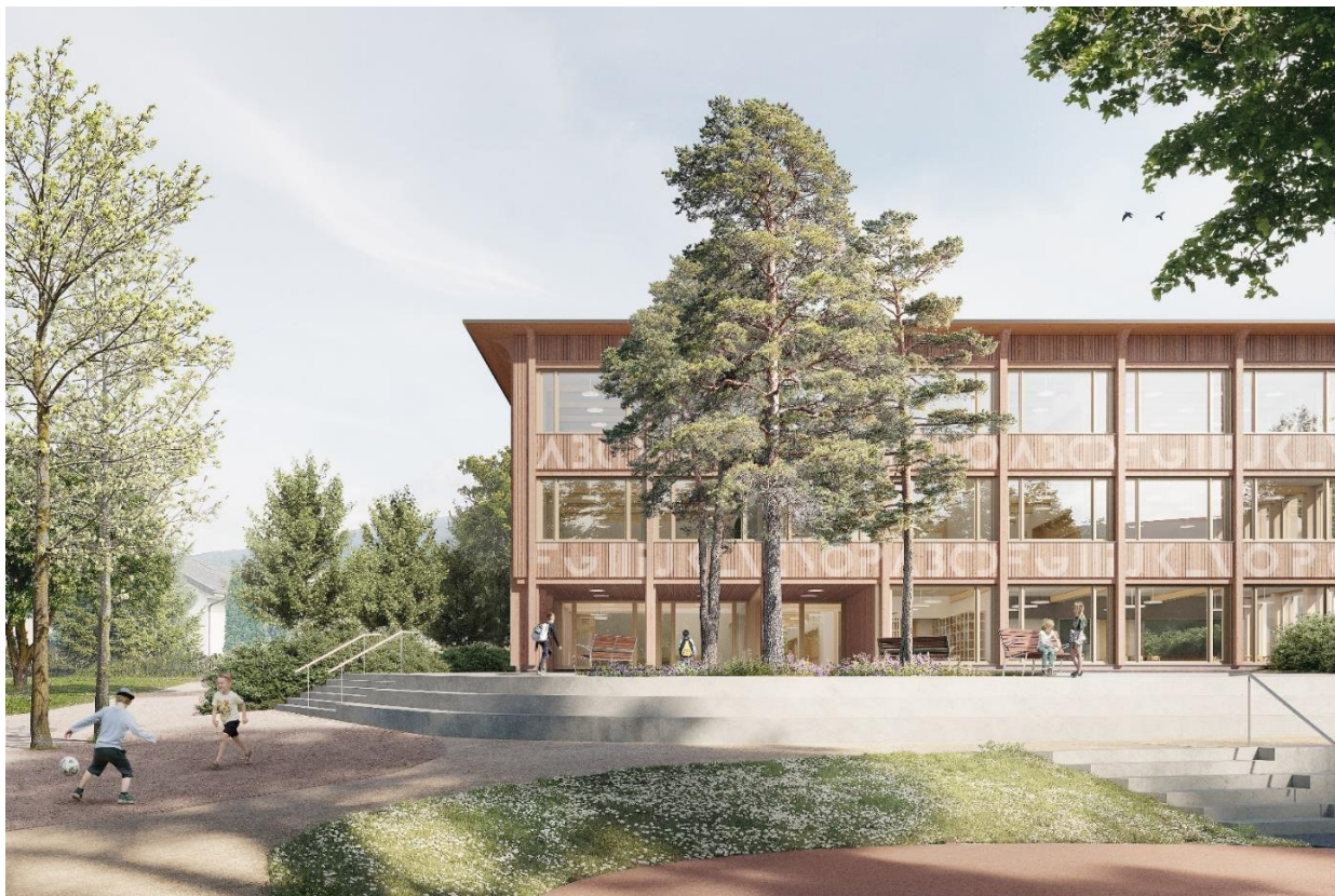
Vue du bâtiment scolaire, esplanade sud-ouest