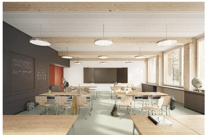
Vue d'une salle de classe