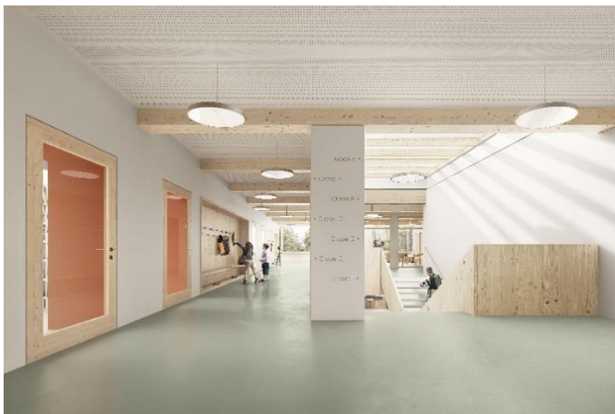
Vue de l'espace collectif intérieur, avec l'escalier central

Le parking actuel comprend 251 places. Du fait de la construction du bâtiment scolaire, le parking sera réorganisé avec une diminution de 66 places. Ce dimensionnement est a priori suffisant selon les comptages de véhicules réalisés dans le parking. A plus long terme, dans le cadre du plan spécial qui sera soumis au Conseil de Ville, un parking en silo ou souterrain pourrait être construit pour accueillir les places nécessaires ainsi que répondre aux besoins futurs (logements). Concernant les places de parc nécessaires aux enseignants, un plan de mobilité pour le site des Arquebusiers a permis de définir les besoins et d'en diminuer le nombre. Ce plan devra être mis en application avant l'ouverture de la nouvelle école.