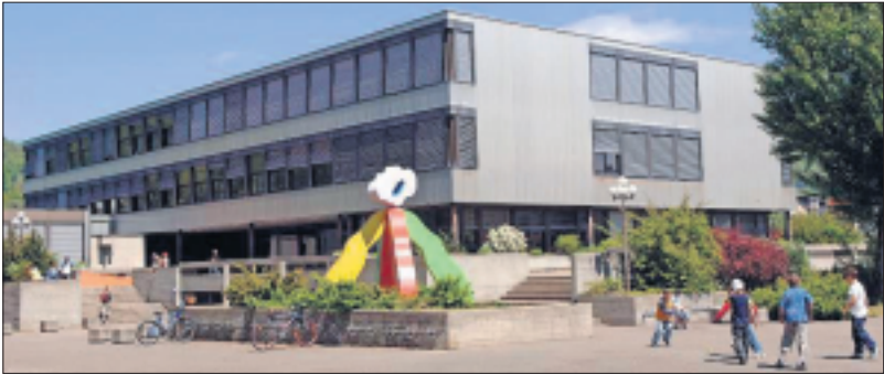
L'arrivée de deux classes supplémentaires au Gros-Seuc oblige les autorités à implanter deux pavillons préfabriqués.