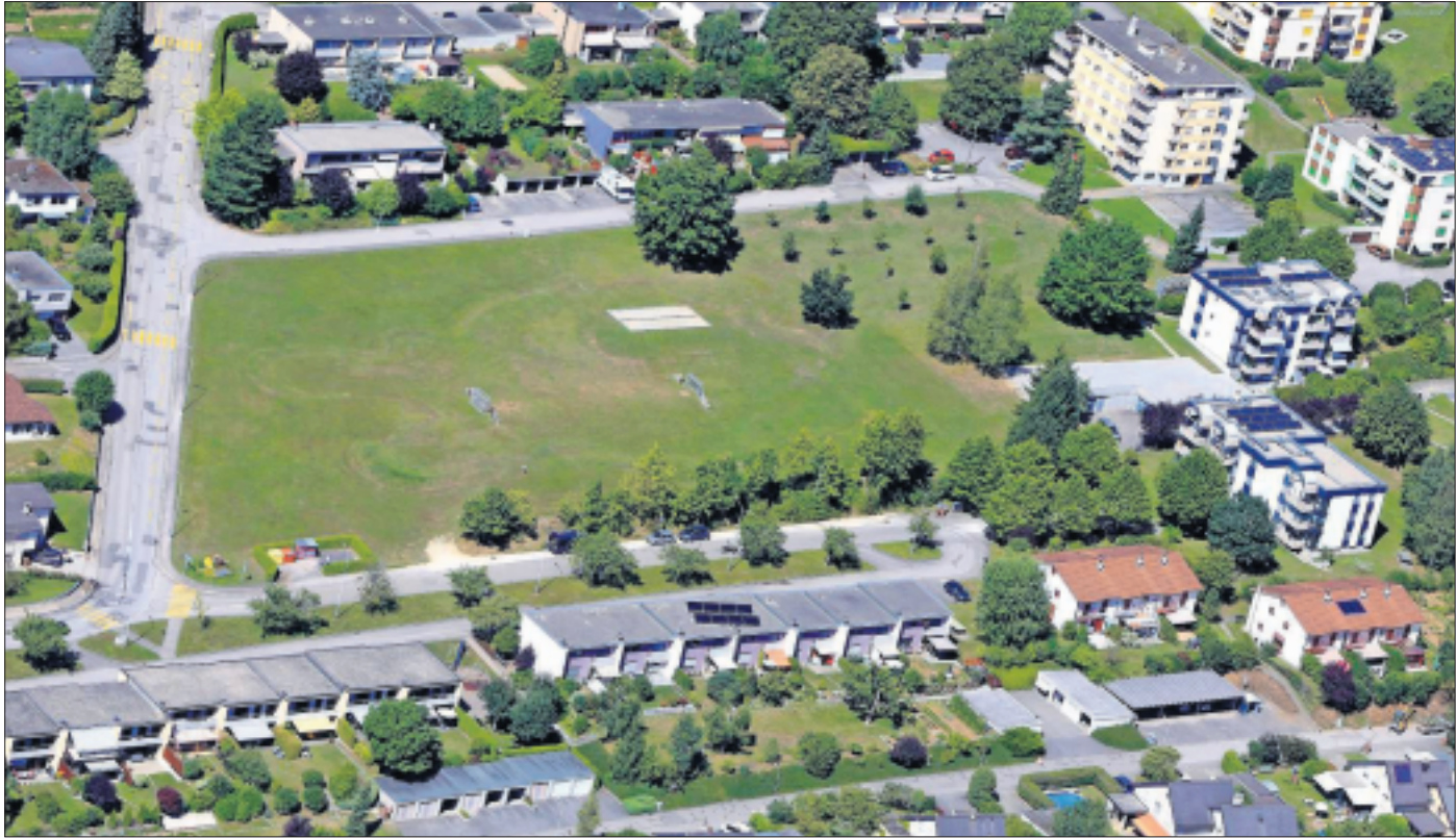
Bloqué depuis cinq ans, le développement de cette grande parcelle de 10 000 m 2 fera l'objet d'un plan spécial, établi en étroite concertation avec les habitants du quartier du Cras-des-Fourches qui accueille à lui seul un quart de la population delémontaine.

«Les habitants du quartier ont vraiment le sentiment de se sentir écoutés. C'est très positif», estime Grégoire Monin (PS) président de la Commission communale de l'Urbanisme, de l'environnement et des travaux publics. Il a suivi de près le travail du comité consultatif chargé de discuter de l'évolution future d'une parcelle de 10 000 m 2 située dans le secteur du Cras-des-Fourches. Trois ateliers participatifs ont permis de sérier les problématiques et ont débouché sur une charte en