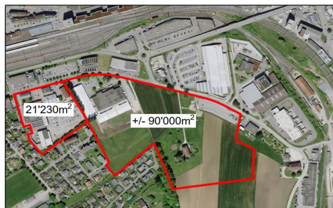
Périmètre d'étude du concours d'idées – Terrains SAFED de 21'230 m 2 côté Ouest

Un concours d'idées en urbanisme avec une démarche participative très active a permis de mener une réflexion approfondie afin de planifier le développement de ces terrains. Le secteur concerné par le concours portait sur une surface de plus de 100'000 m 2 . Afin d'avoir une vision du développement souhaité globale et cohérente, permettant de définir des périmètres clairs en fonction des projets futurs, des esquisses de programmes et de projets ont été proposées par plusieurs groupements de bureaux. Ces propositions ont permis d'évaluer différentes possibilités d'urbaniser ce secteur de la ville. Le projet a reçu un soutien financier important du Canton et de la Confédération, au titre de la politique régionale.