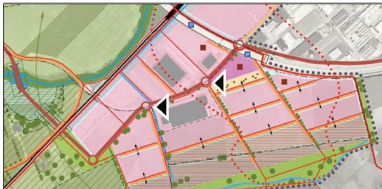
Figure 1 : Extrait de plan directeur localisé "La Communance Sud" et localisation du giratoire concerné par la mesure 3.11 (flèche de droite)

Dans ce cadre, cette proposition a été intégrée dans le projet d'agglomération – PA3, mesures 3.11, qui prévoit donc d'améliorer la desserte en transports publics de la zone d'activités de la Communance. Les bénéfices de cette mesure sont d'améliorer la qualité du système de transports en optimisant l'offre des transports publics et de rendre plus attractif le quartier concerné avec une desserte systématique aller et retour et ainsi encourager l'utilisation des transports publics avec la réduction de l'utilisation de l'automobile. Cette mesure permettra également de favoriser l'insertion des cycles et d'améliorer les entrées et sorties de la rue Robert-Caze ainsi que de l'usine Simon&Membrez.