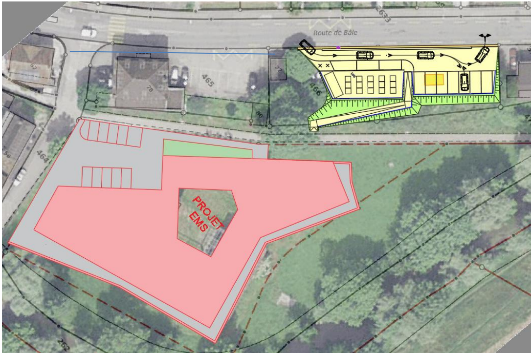
Concept d'aménagement de l'écopoint et liaison piétonne avec le site de l'EMS Sorne

L'accès se fait de manière simple, avec une circulation en sens unique. Il est prévu un système d'entrée et de sortie qui favorise des flux aisés. En sortie, une signalisation obligera le tourner à droite, ce qui permettra de quitter la place facilement (pas de croisement de circulation). Le giratoire au pied de la rue du Vieux-Château permet ensuite de revenir en ville si souhaité. Les dimensions sont conçues pour permettre le passage des camions de chargement de la grande benne et des conteneurs. Un chemin piétonnier avec une pente maximale à 6 % sera également créé pour desservir la Promenade des Deux Rivières et l'EMS Sorne.