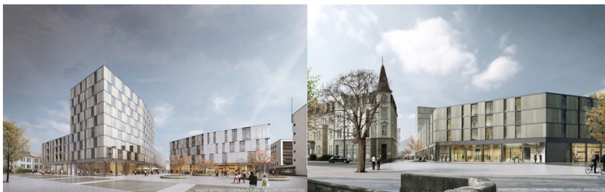
Images du projet – vues des côtés Sud (Place de la Gare) et Nord (Quai de la Sorne)

La sous-utilisation et la vétusté de l'actuel bâtiment postal d'un côté, ainsi que les réflexions sur le quartier de la gare de l'autre, ont incité la Poste à envisager un développement de plus grande ampleur sur ses parcelles et celle qui appartenait initialement à la Municipalité. Un mandat d'études parallèles a été organisé en 2016 et 2017. Sur la base du projet lauréat, un projet immobilier a été développé avec une entreprise totale. Un permis de construire a été délivré pour le futur complexe qui sera doté d'un parking souterrain, de commerces, d'un hôtel, de bureaux et de logements. Les travaux débiteront en septembre.