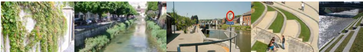
Plan directeur localisé « Aménagement de la Sorne et de ses abords » (2011), coupes dont la variante avec gradins au quai de la Sorne