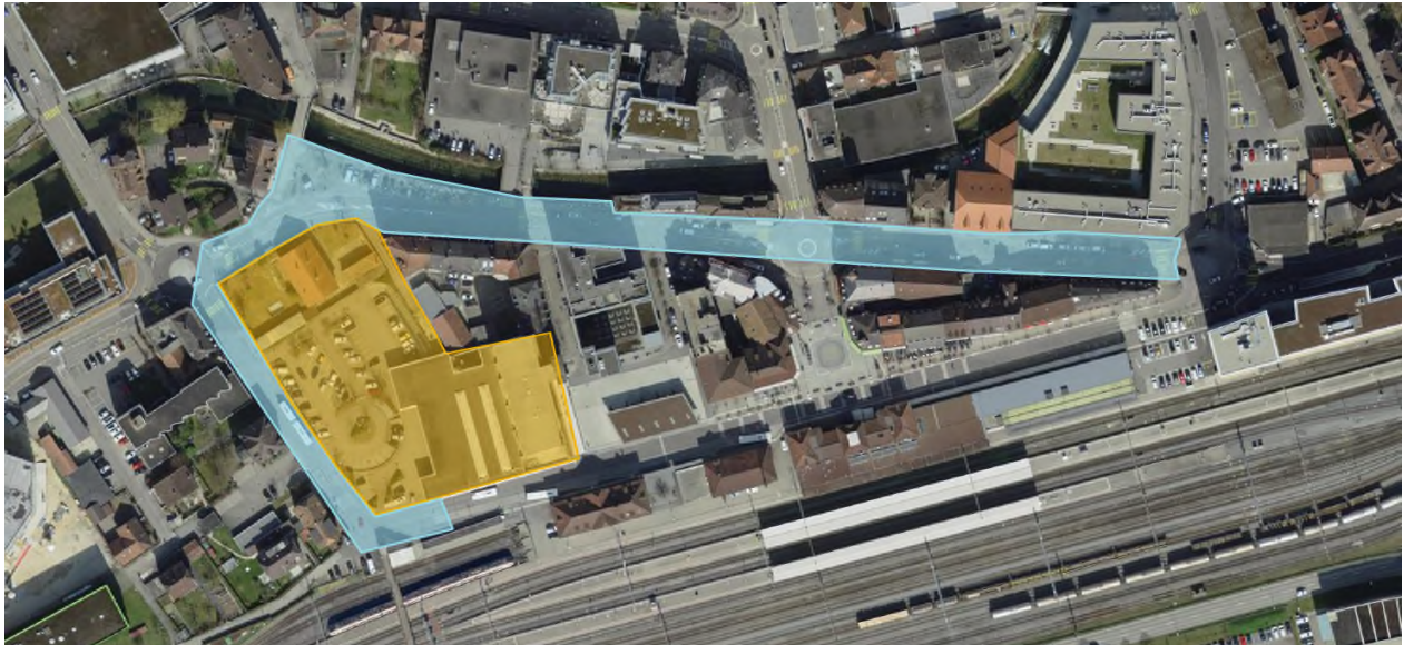
Périmètre d'étude en bleu et périmètre du projet « Posteimmobilier » en orange (source : géoportail modifié, 2019) https://geo.jura.ch/s/OWki

Les réaménagements du quai de la Sorne et de la route de Moutier devront être coordonnés avec le Projet d'agglomération de Delémont (mesure 1.4a3) et avec le projet Delémont Marée Basse séquence Centre amont (lot 3) dont les études sont en cours.