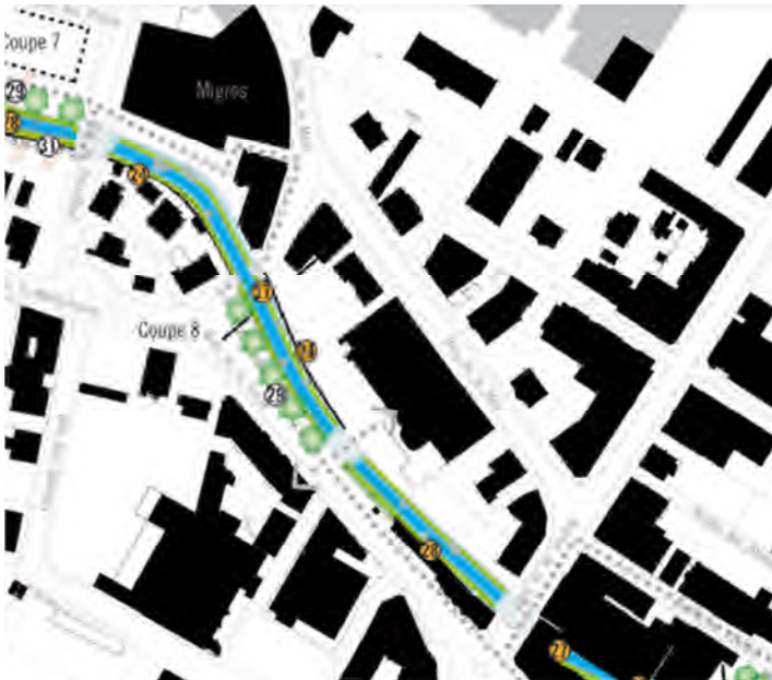
Extrait du Plan directeur localisé « Aménagement de la Sorne et de ses abords » (2011) adopté par le Conseil de Ville

La berge située au Sud pourrait être aménagée avec des gradins descendant sur la rivière afin de créer un espace public attractif tout en réaménageant le lit du cours d'eau.