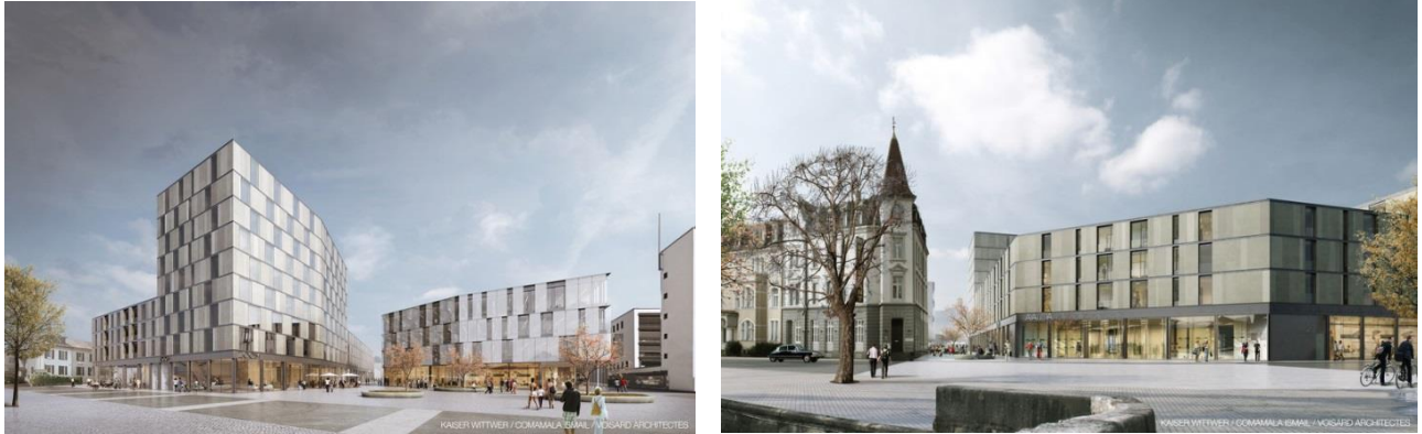
Images du projet "Poste Immobilier" – vues des côtés Sud (place de la Gare) et Nord (quai de la Sorne)

La Poste sera l'unique propriétaire des terrains sur lesquels se situera le projet "Poste Immobilier" pour des questions de cohérence. Un droit de superficie n'est pas réalisable du fait que le futur bâtiment se trouverait sur deux parcelles appartenant à des propriétaires différents, ce qui poserait des problèmes tant pour le financement du projet que pour sa gestion.