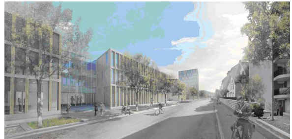
Images du futur Campus HE - vue depuis les voies CFF et depuis la route de Moutier

Le projet rendu a permis de définir une image globale et cohérente concernant la construction sur l'ensemble de la parcelle communale, comme le montre la maquette ci-dessous.