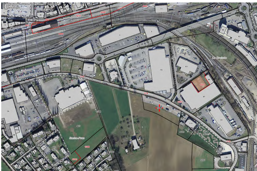
Situation de la parcelle no 5189

La Municipalité de Delémont est propriétaire de la parcelle no 5189 du ban de Delémont suite à un échange qui a été signé en 2010 avec l'ancien propriétaire. Ce dernier avait mis à disposition de Lora SA, la société qui exploite La Croisée des Loisirs, le terrain nécessaire à l'aménagement de 94 places de parc, pour les besoins de cette dernière. Un contrat de bail a été conclu pour une durée initiale de cinq ans (du 1 er janvier 2005 au 31 décembre 2009). Il a été renouvelé tacitement et repris par la Municipalité suite à l'échange de terrain.