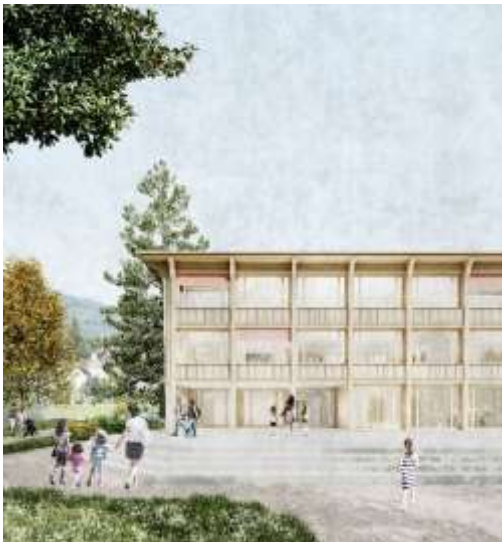
Vue du bâtiment scolaire, esplanade sud-ouest