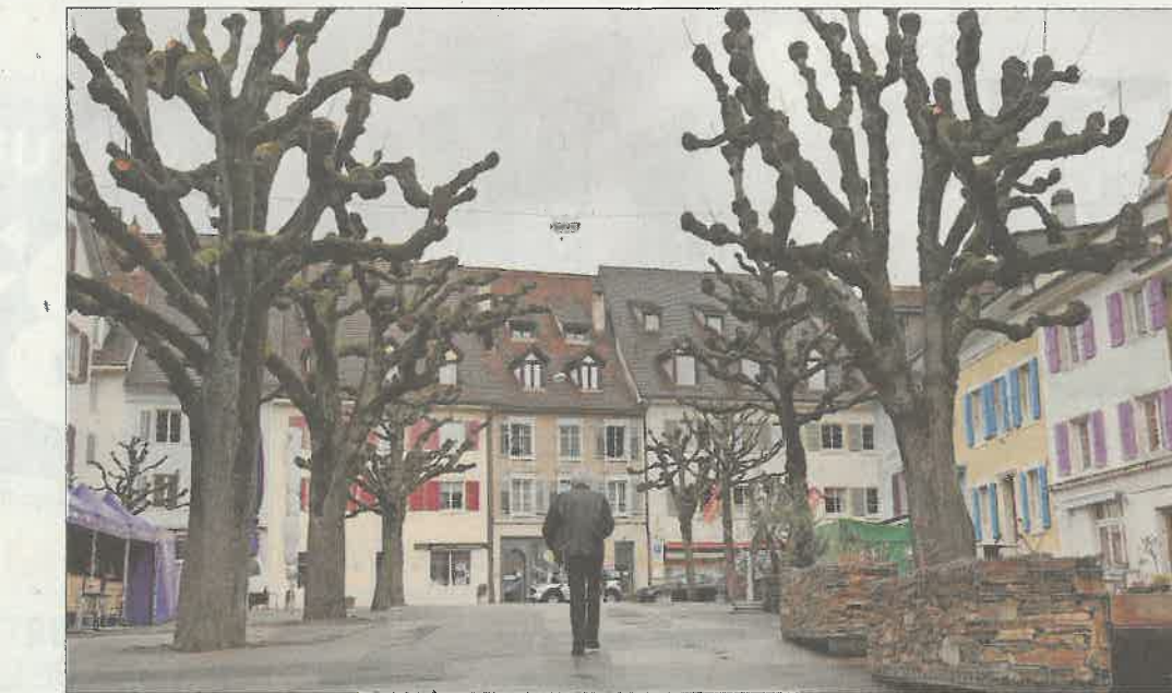
La population delémontaine était conviée à faire part de ses constats et de ses propositions pour réaménager la place Roland-Béguelin.