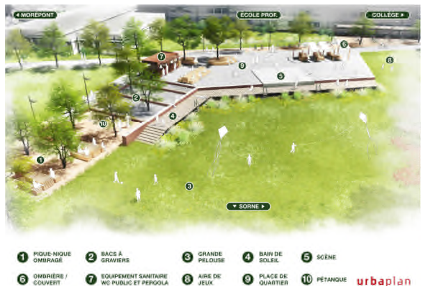
Figure 3 : intention d'aménagement du parc (pour mémoire)