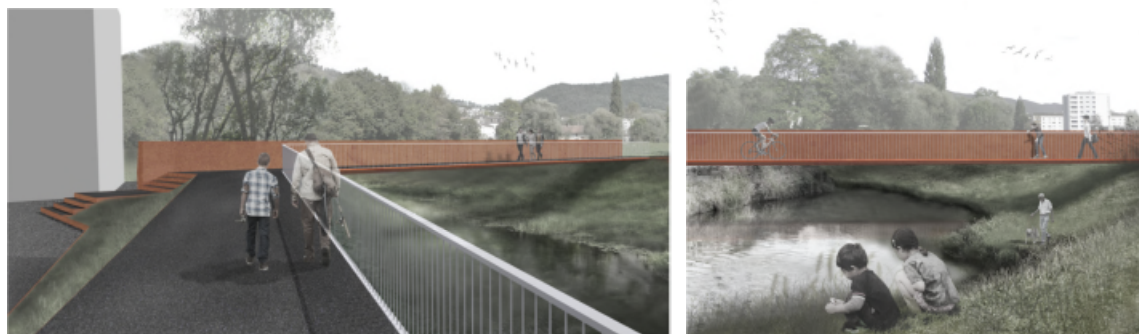
Figure 2 : images des passerelles

Le dimensionnement et le profil des ouvrages découlent d'une conception globale qui révèle la volonté des auteurs de mettre en valeur la rivière. L'usage du corten, matériau noble, d'un caractère chaleureux, permet une bonne intégration des ouvrages dans le milieu naturel.