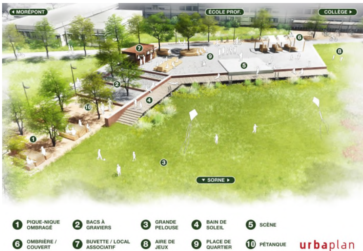
Figure 3 : image du projet de parc urbain

Le projet de parc urbain est situé dans le prolongement Ouest du plan spécial n° 74 « EUROPAN 9 – Gros Seuc ». Il découle de l'image directrice des espaces publics de la plaine de Morépont. Cet espace de détente et de loisirs en milieu construit constitue une zone de transition entre l'espace dédié à la Sorne et celui réservé à l'habitat et aux écoles.