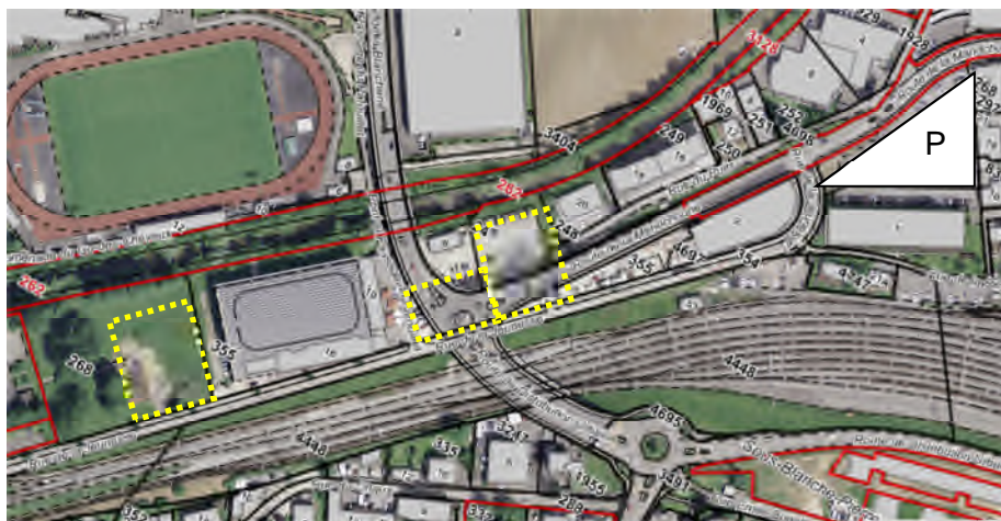
Fig. 1 : Situation du parking actuel de la Mandchourie (P) et des nouvelles zones de stationnement aux abords de la patinoire

Les nouveaux parkings doivent également permettre de satisfaire les besoins en stationnement lors de manifestations à la patinoire et au Centre sportif notamment.