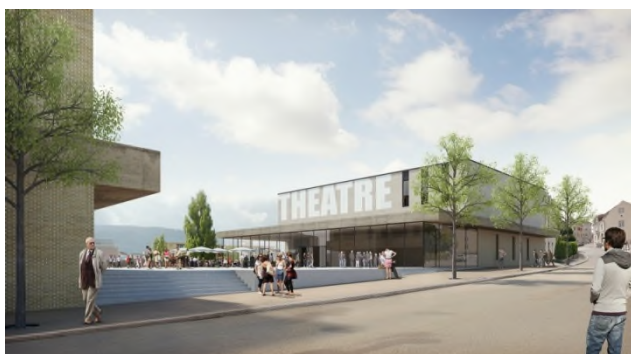
Entrée du Théâtre avec son esplanade