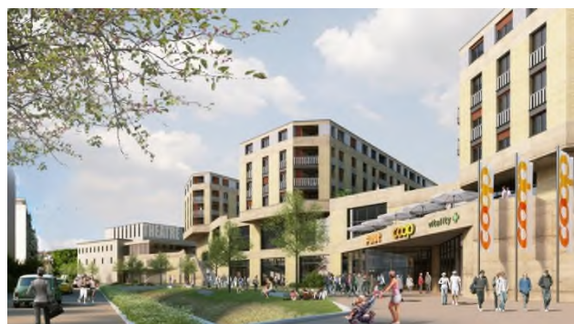
Images du projet - vues des côtés Nord (route de Bâle) et Sud (rue de la Brasserie - Ticle)