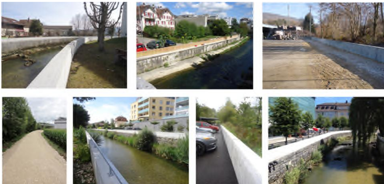
Plan d'alarme - Mesures anticipées : illustrations des diverses réalisations

Les travaux relatifs à la mise en œuvre des mesures anticipées sont achevés. Les réalisations peuvent être observées à la hauteur de l'usine RBC-Schäublin, du locatif Compatible, du Quai de la Sorne ou encore du côté de Paco Garage.